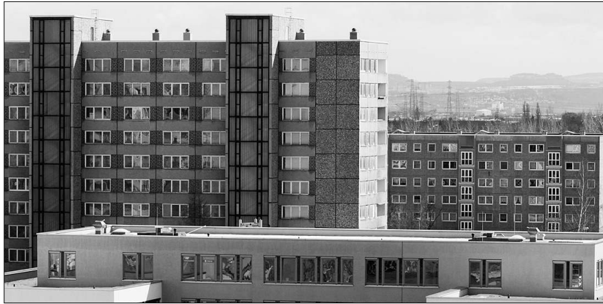
Alles raus: Verkaufte Dresdner Wohnungen sanieren Stadtklasse – und machen Mieter nervös